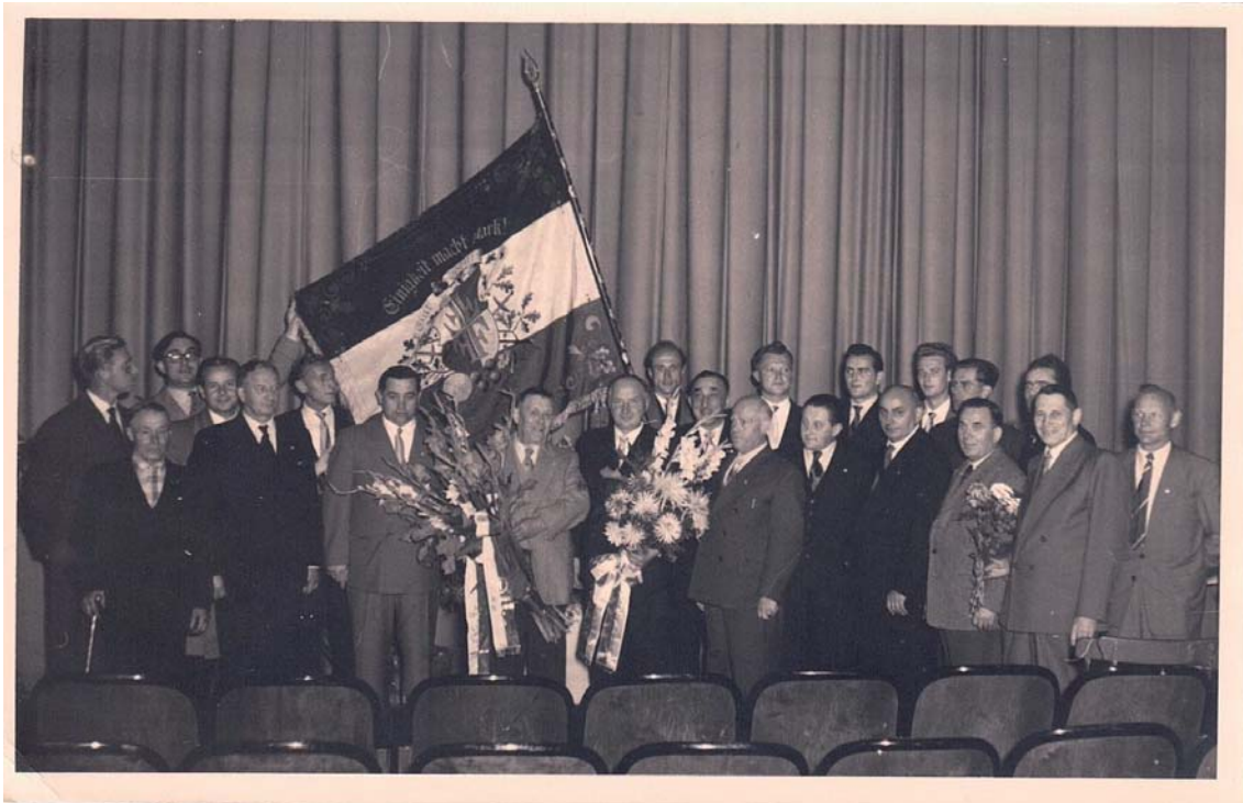
Feierstunde im Olympia-Kino

Nach diesen Feierlichkeiten wurde eine sportliche Bilanz gezogen. Diese sah sehr traurig aus. Durch das Spielen in der Oberliga war die Breitenarbeit gröblich vernachlässigt worden. Die Hoffnung, dass die abgestiegenen Spieler die Jugend betreuen und ausbilden würden, erfüllte sich nicht. Der Mitgliederbestand war bedenklich gesunken. So mußte wieder fast von vorn angefangen werden.