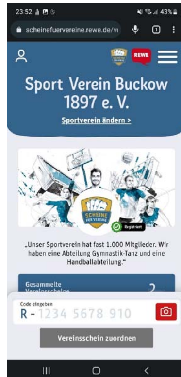
Foto-Symbol und folge dem Schritt 6.